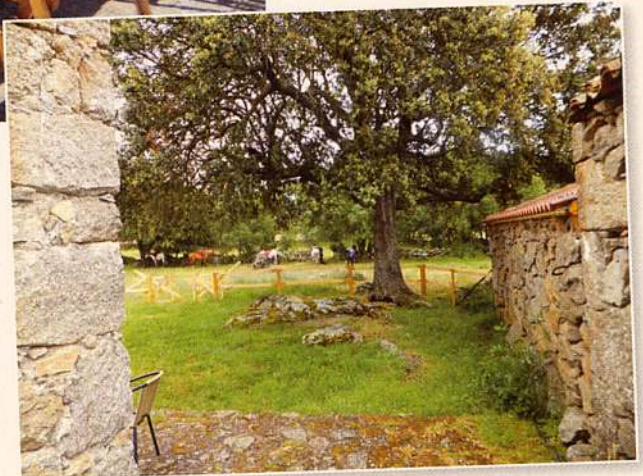
Eten en overnachten in een 'casa rural', een echte herberg met fijn weiland voor de paarden

Meer informatie over deze reis bij www.horseholiday.com of www.ridingholidaysspain.com