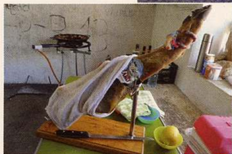
Nooit geweten: pata negra-ham is vernoemd naar de zwarte varkenspoot. Heerlijk als tussendoortje