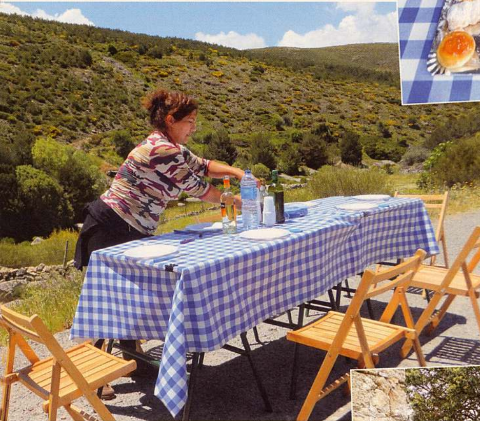
Emilio's vrouw Mamen in de weer met onze lunch